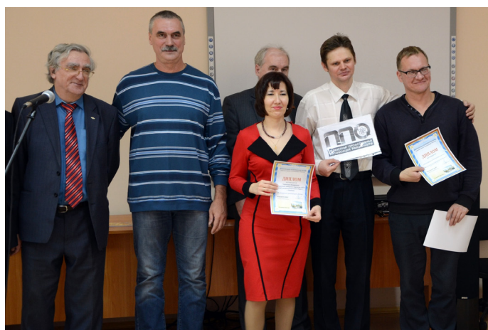
В поэтической дуэли ЗАТО победили снежинцы

Презентация альманаха состоится в городской библиотеке Снежинска после улучшения эпидемиологической обстановки.